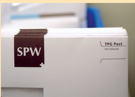
Klanttevredenheidsonderzoek werkgevers SPW 2009

Gedurende de eerste vijf maanden van 2010 is het vermogen gestegen met ruim 600 miljoen euro. De verplichtingen stegen in »