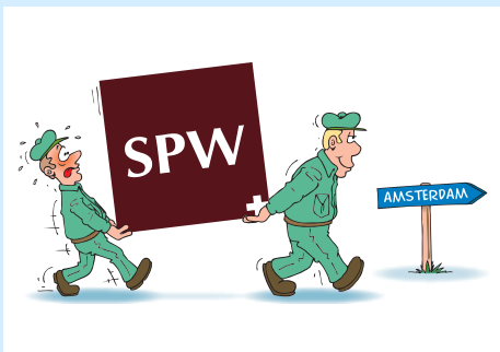
SPW gaat verhuizen pagina 2