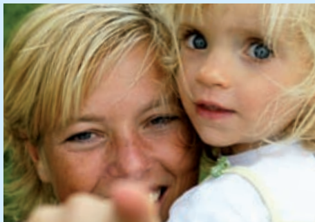
De startbrief: de belangrijkste informatie samengevat pagina 3