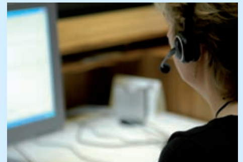
Geef indienst- en uitdiensttredingen tijdig door aan SPW pagina 3